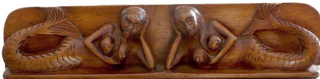
Deux Sirènes couchées. Sculpture sur bois de palissandre. Artisanat malgache