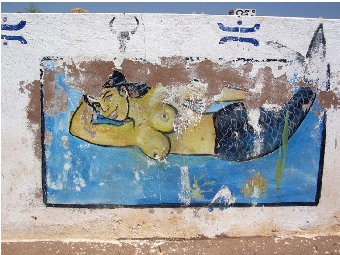
Sirènes funéraires de la région de Toliara